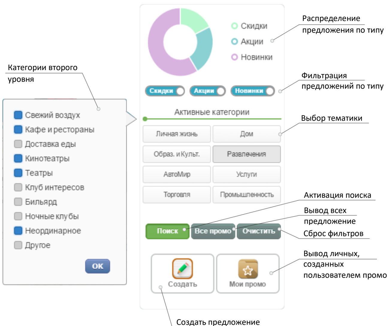
Рис. 3 – Панель управления

Панель, расположена в правой части экрана и служит для навигации по разделу Предложения.