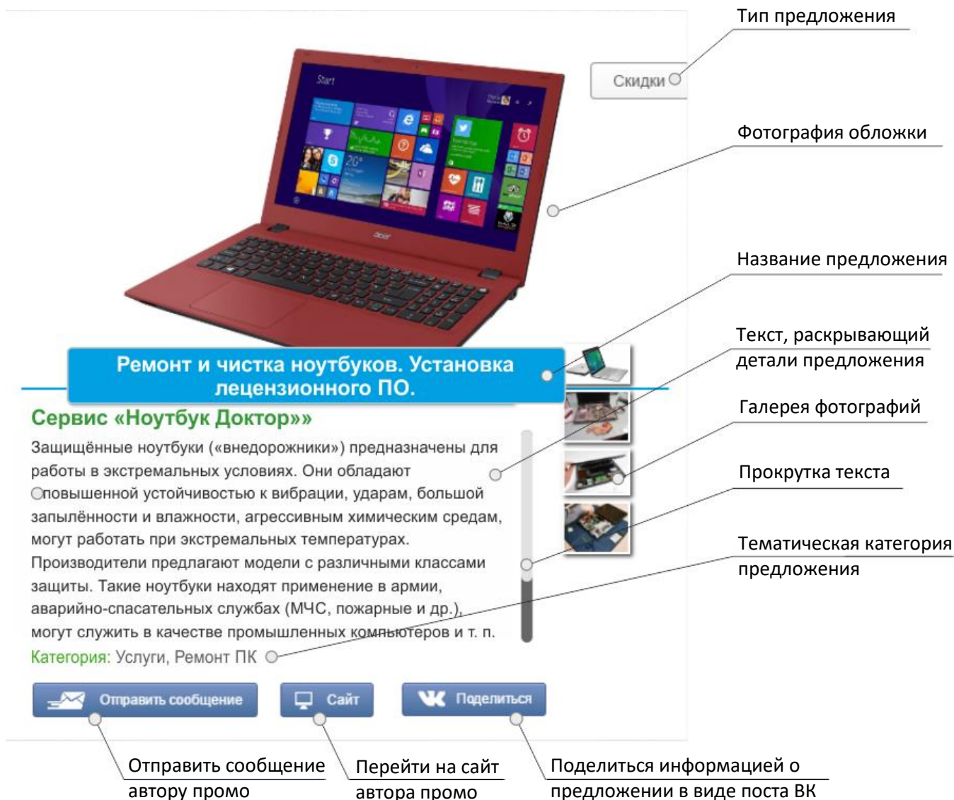
Рис. 2 – Подробный просмотр Предложения

Кликнув на Промо в потоке, мы попадаем в режим подробного просмотра предложения. Здесь мы видим: лейбл – тип промо, заголовок и подробное описание предложения; название компании и тематическую категорию предложения.